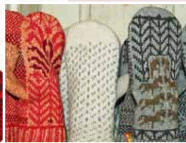
Fantastiskt varma och sköna helfodrade vantar från Öjebyn.