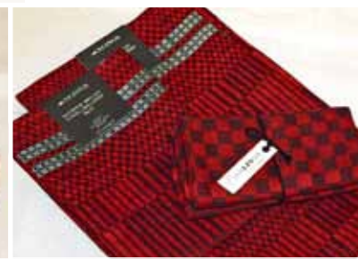
Handdukar och löpare till jul, Axlings linne.