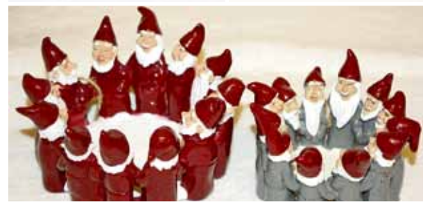
En klassiker på Akeba, tomtering för värmeljus.