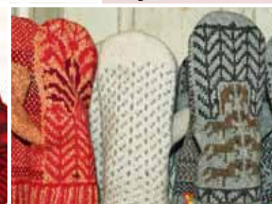
Fantastiskt varma och sköna helfodrade vantar från Öjebyn.