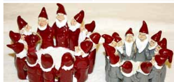
En klassiker på Akeba, tomtering för värmeljus.