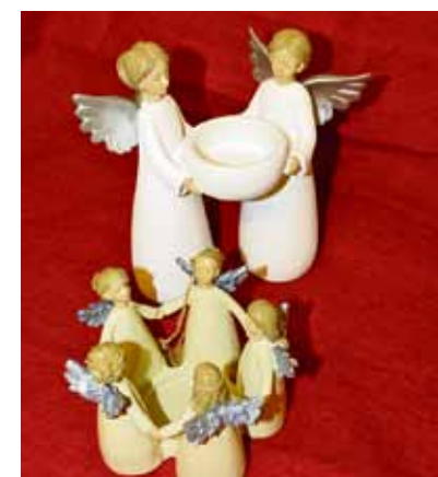
Änglar för värmeljus.

Julskyltningen har vi också klarat av den här veckan. Resultatet är klart tillfredsställande. Vi ser verkligen fram