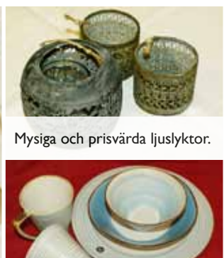
Mysiga och prisvärda ljuslyktor.