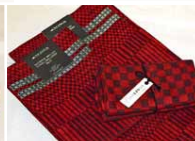
Handdukar och löpare till jul, Axlings linne.