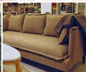
Soffa Pure, Homeline.